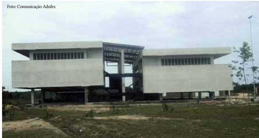
Biblioteca inacabada prejudica qualidade do ensino em São Mateus.

curso de licenciatura está diretamente ligada à melhoria da estrutura do campus como um todo.