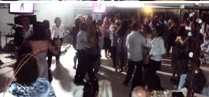
Festa do Professor é marcada por confraternização e animação em Alegre, São Mateus e Vitória